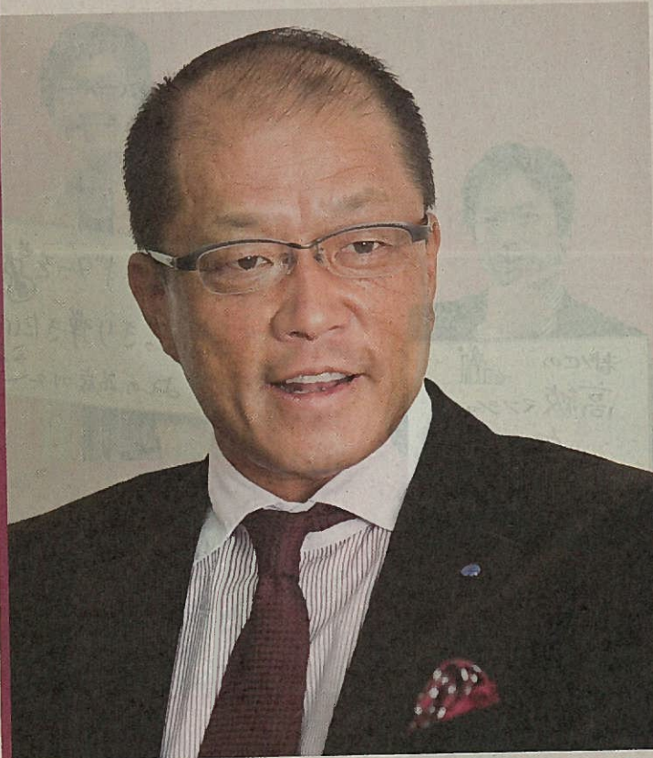
株式会社コスギ不動産 代表取締役

“人対人”の原点を大切に、 地元企業だから提供できる 心の通うサービスを目指します。